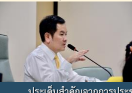
ประเด็นสำคัญจากการประชุม

ด้านการส่งเสริมสุขภาพ ครั้งที่ 9/2567 ณ ห้องประชุมสำนักส่งเสริมสุขภาพ อาคาร 7 ชั้น 3 เพื่อให้การปฏิบัติภารกิจเป็นไปตามเจตนารมณ์ที่กำหนดและสอดคล้องกับการพัฒนาบทบาทภารกิจ และกลไกการขับเคลื่อนการดำเนินงานที่พึงประสงค์ของกรมอนามัย ผู้เข้าร่วมประชุม ประกอบด้วยคณะกรรมการพัฒนาและขับเคลื่อนงานวิชาการ (กพว.) ด้านการส่งเสริมสุขภาพ และผู้เกี่ยวข้อง จำนวน 20 คน