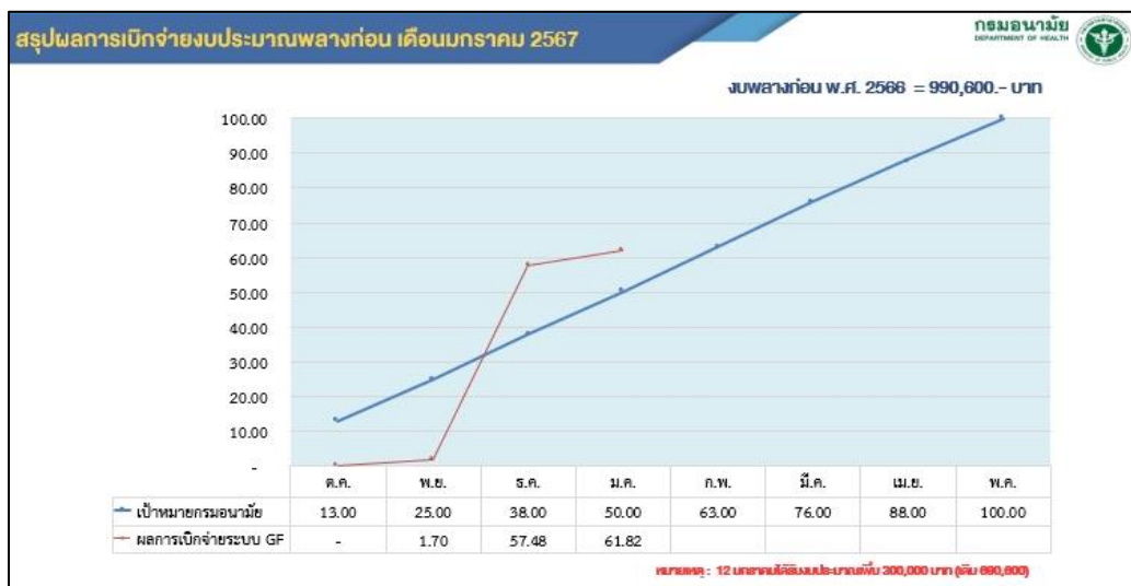
รูปที่ ๓ สรุปผลการเบิกจ่ายงบประมาณพลาถก่อน เดือนมกราคม ๒๕๖๗ ระบบ GFMS

สำหรับผลการเบิกจ่ายงบประมาณของกองอนามัยวัยเรียนวัยรุ่น (ตามกรอบการจัดสรรงบประมาณรายจ่ายประจำปีงบประมาณ พ.ศ. ๒๕๖๖ ไปพลาถก่อน) ข้อมูลลงระบบ GFMS ณ วันที่ ๓๑ มกราคม ๒๕๖๗ กองอนามัยวัยเรียนวัยรุ่นเบิกจ่ายได้จำนวน ๖๑๒,๔๒๘ บาท คิดเป็น ร้อยละ ๖๑.๘๒ ซึ่งเกินค่าเป้าหมายที่กรมอนามัยกำหนดไว้ ณ เดือนมกราคม ๒๕๖๗ ที่ร้อยละ ๕๐