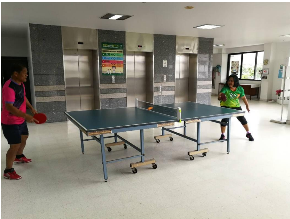
ภาพการออกกำลังกายหลังเลิกงาน