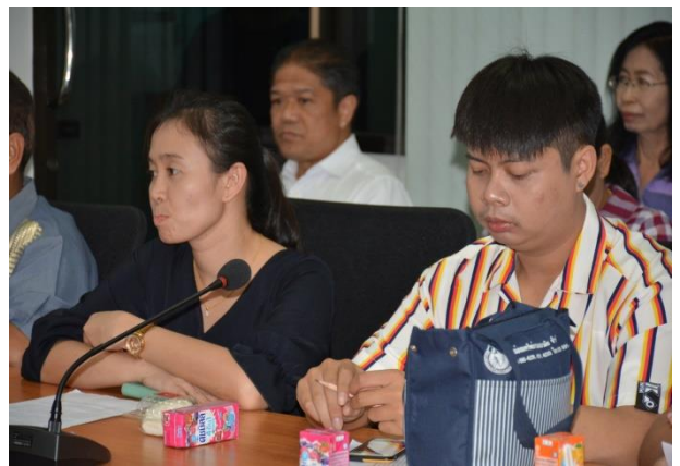
เครือข่าย กพร. สำนักส่งเสริมสุขภาพ/ สรุปผลการดำเนินงาน