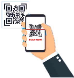
1. แสแกนคิวอาร์โค้ด