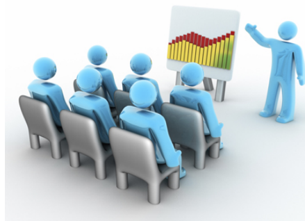
3. รายงานผลการสำรวจ