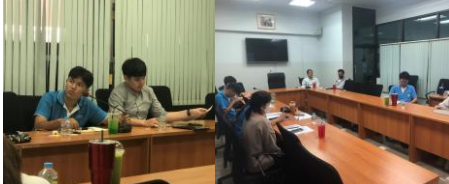
ห้องประชุมกองอนามัยวัยทำงาน