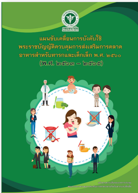
แผนขับเคลื่อนพระราชบัญญัติควบคุมการส่งเสริมการตลาดอาหารสำหรับทารกและเด็กเล็ก พ.ศ. 2560 (พ.ศ. 2563-2565)

2.2 จัดทำแนวทางการบริจาคมผงและนมสำหรับเด็ก ในช่วงสถานการณ์การแพร่ระบาดของ COVID-19 เพื่อให้เกิดประโยชน์สูงสุดแก่ผู้บริจาคมและผู้เข้ารับบริจาคม และเป็นไปตามพระราชบัญญัติควบคุมการส่งเสริมการตลาดอาหารสำหรับเด็กเล็ก พ.ศ. 2560