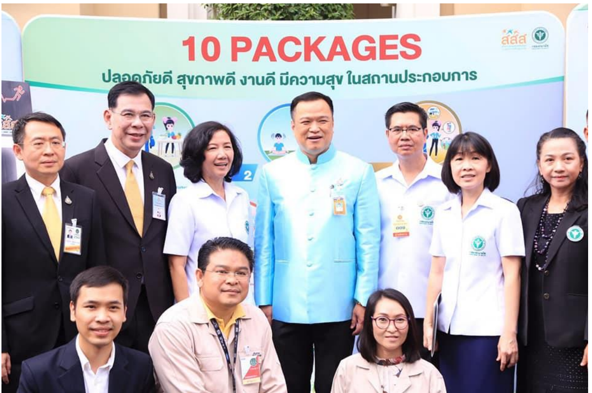
สรุปโครงการพัฒนารูปแบบการส่งเสริมสุขภาพวัยทำงานในสถานประกอบการเพื่อคุณภาพชีวิตที่ดี/จุฬารัตน์