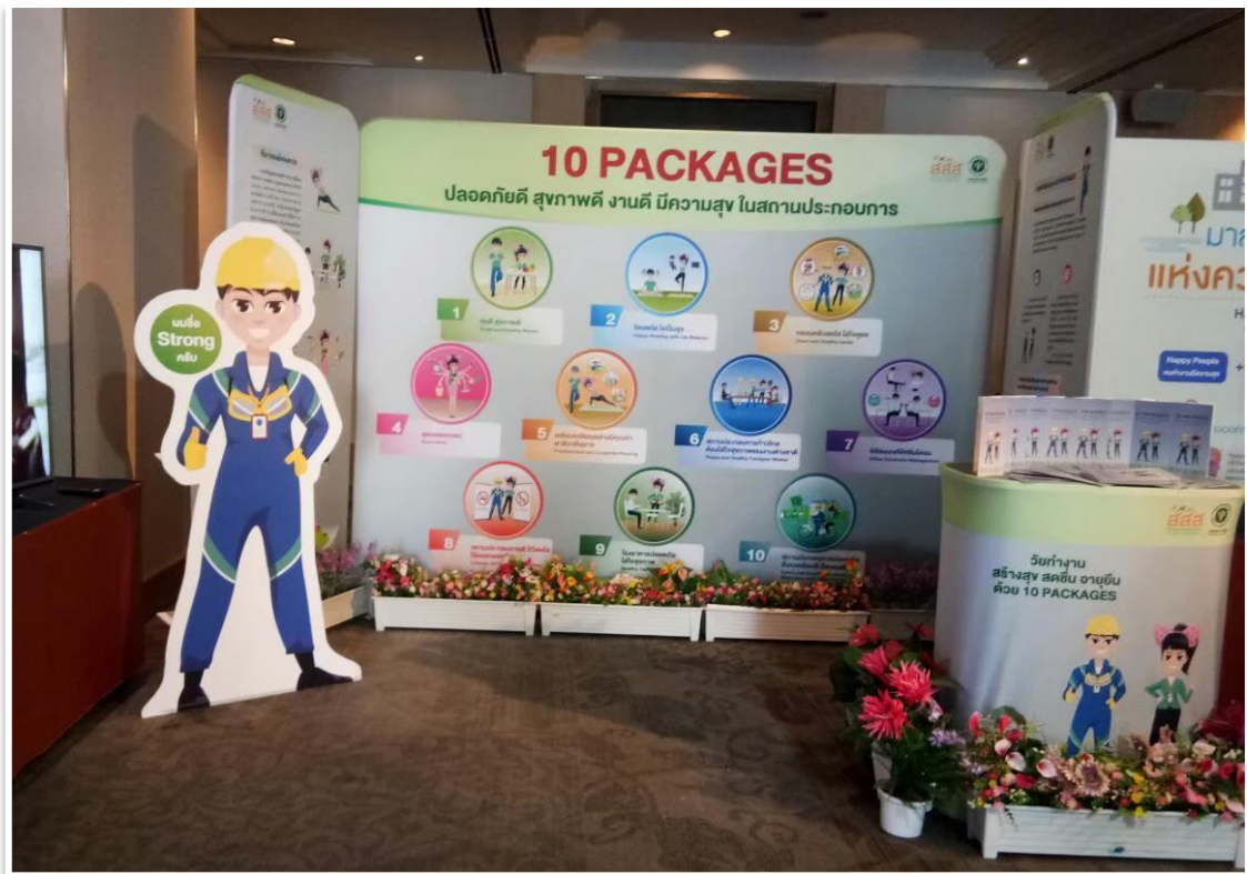
สรุปโครงการพัฒนารูปแบบการส่งเสริมสุขภาพวัยทำงานในสถานประกอบการเพื่อคุณภาพชีวิตที่ดี/จุฬารัตน์