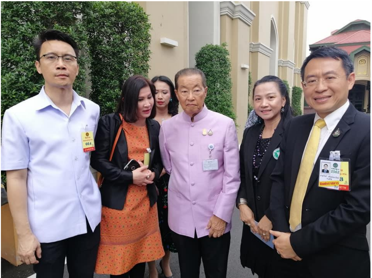
สรุปโครงการพัฒนารูปแบบการส่งเสริมสุขภาพวัยทำงานในสถานประกอบการเพื่อคุณภาพชีวิตที่ดี/จุฬารัตน์