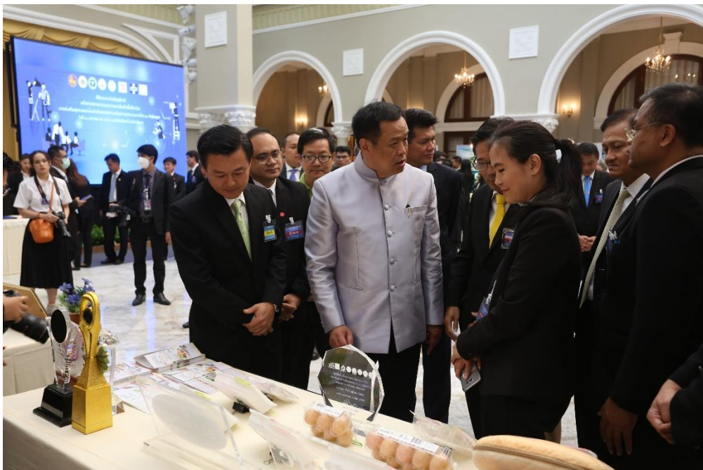
สรุปโครงการพัฒนารูปแบบการส่งเสริมสุขภาพวัยทำงานในสถานประกอบการเพื่อคุณภาพชีวิตที่ดี/จุฬารัตน์