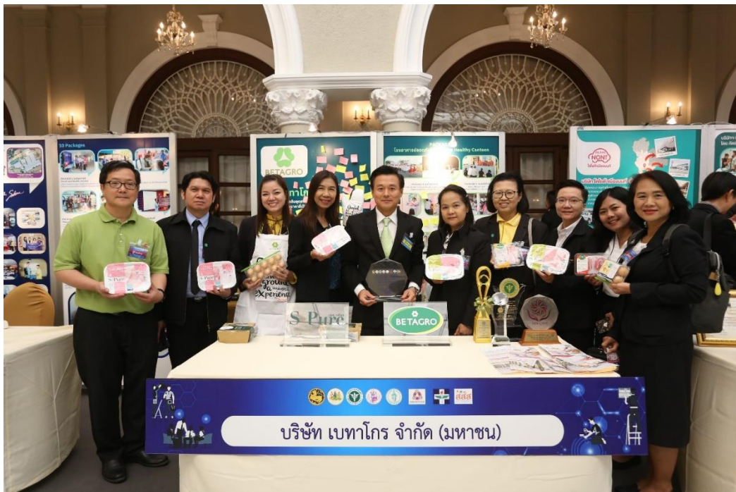
สรุปโครงการพัฒนารูปแบบการส่งเสริมสุขภาพวัยทำงานในสถานประกอบการเพื่อคุณภาพชีวิตที่ดี/จุฬารัตน์