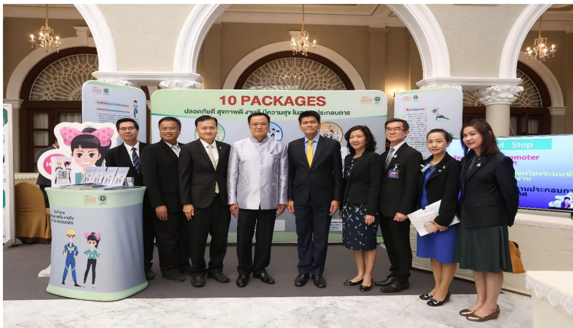
สรุปโครงการพัฒนารูปแบบการส่งเสริมสุขภาพวัยทำงานในสถานประกอบการเพื่อคุณภาพชีวิตที่ดี/จุฬารัตน์