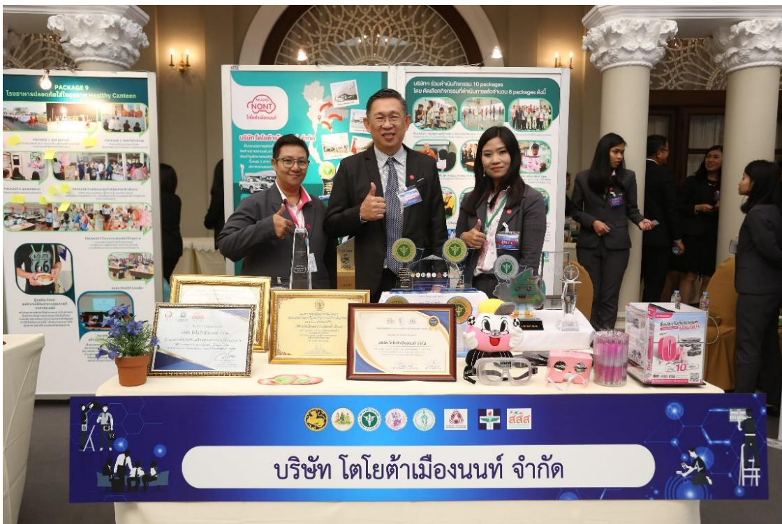
สรุปโครงการพัฒนารูปแบบการส่งเสริมสุขภาพวัยทำงานในสถานประกอบการเพื่อคุณภาพชีวิตที่ดี/จุฬารัตน์