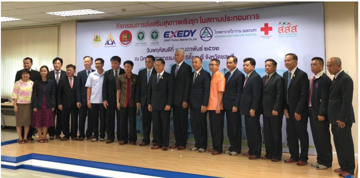
สรุปโครงการพัฒนารูปแบบการส่งเสริมสุขภาพวัยทำงานในสถานประกอบการเพื่อคุณภาพชีวิตที่ดี/จุฬารัตน์