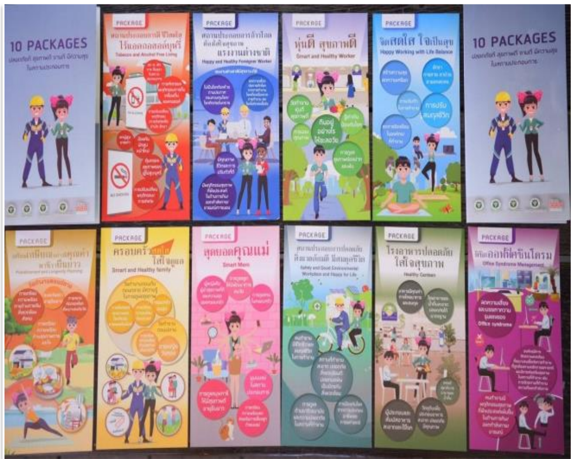
สรุปโครงการพัฒนารูปแบบการส่งเสริมสุขภาพวัยทำงานในสถานประกอบการเพื่อคุณภาพชีวิตที่ดี/จุฬารัตน์