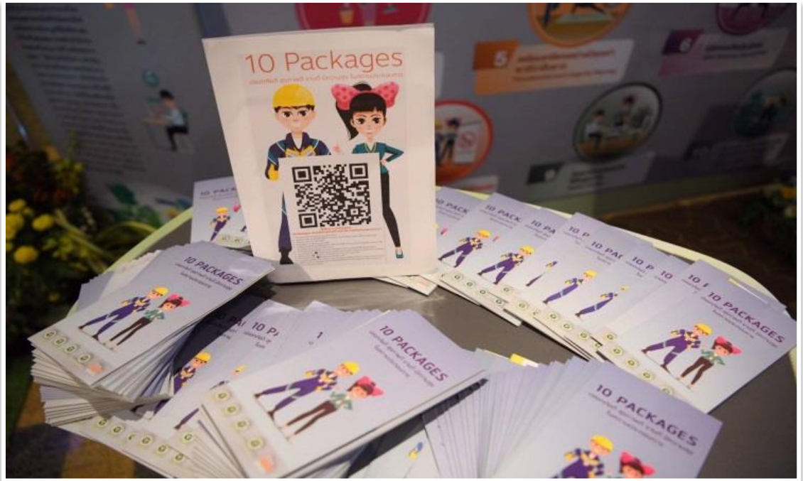
ข้อมูลเนื้อหาจาก แผ่นปลิว ๑๐ Packages แนวทางส่งเสริมสุขภาพและอนามัยสิ่งแวดล้อมในสถานประกอบการ (Brochure) สามารถดาวน์โหลดได้จาก QR Code ในไลน์ได้