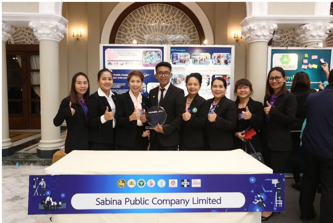
สรุปโครงการพัฒนารูปแบบการส่งเสริมสุขภาพวัยทำงานในสถานประกอบการเพื่อคุณภาพชีวิตที่ดี/จุฬารัตน์